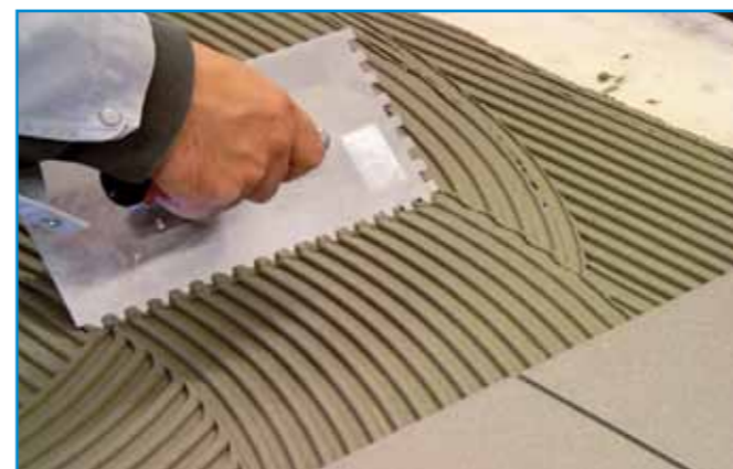
A ragasztóanyagot fogazott glettvassal, egyenletes vastagságban hordjuk fel.

Bedolgozhatósági idő: Az anyag a bekeverés befejezésétől kb. ennyi ideig használható fel (átkeverés szükséges lehet)