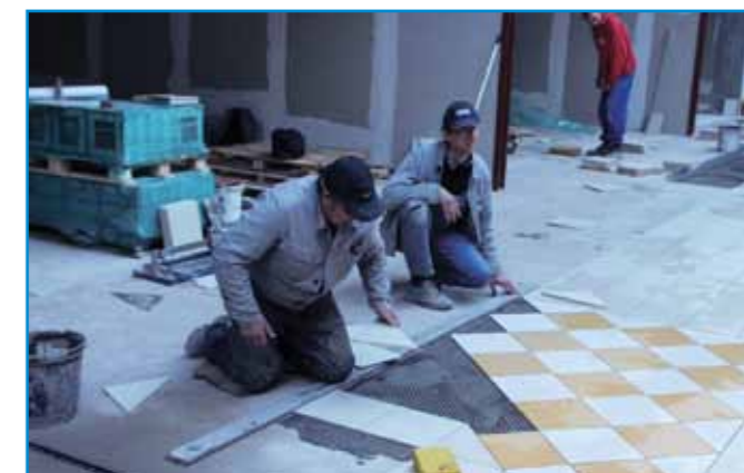
Nagy forgalmú terek burkolásakor a ragasztót az alapfelületre és a burkolat hátoldalára egyaránt hordjuk fel.