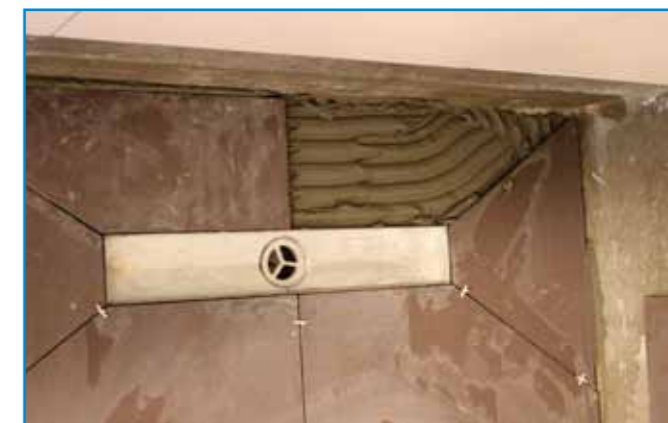
Fugakeresztek használatával biztosítható a lapok precíz illesztése.