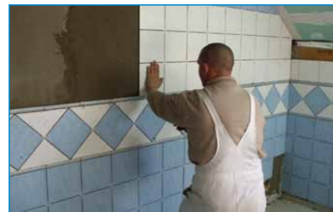
Egyedi megoldásokkal mozgalmassá tehető a falburkolat.

Bedolgozhatósági idő: Az anyag a bekeverés befejezésétől kb. ennyi ideig használható fel (átkeverés szükséges lehet)