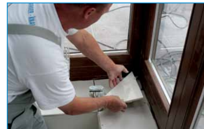
Fehér lapoknál célszerű fehér flexibilis ragasztó (Flex W) használata.