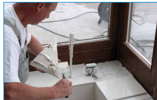
Fokozott hőmozgású helyeken a flexibilis ragasztót az alapfelületre és a burkolat hátoldalára egyaránt hordjuk fel.